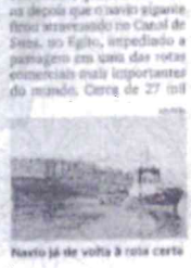
Navio já de volta à rota certa

Equipes de resgate conseguiram desatolar o navio de contêineres Ever Given depois que o navio ficou preso no Canal de Suez, no Egito, impedindo a passagem por uma das rotas comerciais mais importantes do mundo.