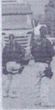
Agentes em exposição a riscos

governadora que defendem a vacinação prioritária de policiais. "Tendo em vista as condições de trabalho dessas agentes municipais, é preciso estar plenamente justificada na presente sede, pois se trata de uma categoria de profissionais de atividade funcional de caráter essencial para a manutenção do Estado. Assim, a AGU acredita que a vacinação de policiais deve ser dada prioridade em relação a outros servidores públicos", afirma o advogado.