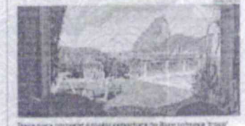
Caixa Econômica Federal